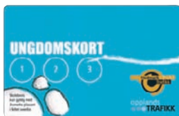
Ungdomskortet for Hedmark.