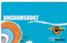
Ungdomskortet for Oppland.

Ungdomskortet gjelder for ungdom fra de fyller 15 til fylte 20 år og for et ubegrenset antall reiser i Hedmark og Oppland. Kortet er gyldig i 30 dager. I Hedmark fås kortet kun gjennom henvendelse til noen sparebanker i Hedmark (se pkt 3.6.1). I Oppland er det førstegangs kjøp ved Lillehammer Skysstasjon, Turistkontoret Gjøvik-Land-Toten eller via nettbutikk på www.innlandskortet.no (se pkt 3.6.2).